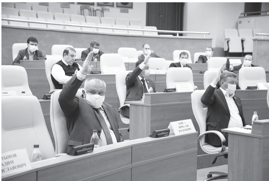
Если первое пленарное заседание в условиях пандемии (5 мая) депутаты провели в масках и без приглашенных, то на этот раз народных избранников еще и рассадил на положенную социальную дистанцию, из-за чего они были вынуждены отказаться от привычного электронного голосования - персональные кнопки для него переносить и переподключать было справедливо сочтено нецелесообразным. В итоге впервые чуть ли не за два десятка лет депутаты голосовали простым поднятием рук.

Что же касается ТФОМС, то объем его доходов увеличен на 82,4 миллиона за счет трансфертов из Федерального фонда обязательного медицинского страхования. За их счет, а также за счет перераспределения средств дополнительно выделено 171,4 миллиона рублей на финансирование оплаты труда врачей и